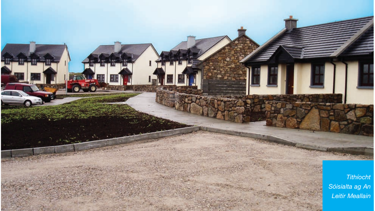
Tithíocht Sóisialta ag An Leitir Meallain

Lean an Chomhairle, i gcomhar le CLÁR, na cuideachtaí LEADER a bhaineann le hábhar agus leis na pobail áitiúla, ag freastal ar thionscadail faoin Scéim Feabhsúchán ar Shráidbhailte agus faoin Tuath. Rinneadh dul chun cinn maidir leis na tionscadail sna háiteanna seo a leanas i rith na bliana 2006: