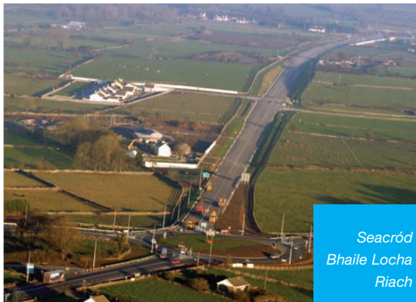
Seacród Bhaile Locha Riach

bus leis an obair phíolótach ar foscadáin a thabhairt chun cinn i limistéir a thagann faoi Thionscnamh lompair na Tuaithe. Cuireadh Grúpa Comhairle ar bun chun seirbhís faoi Thionscnamh lompair na Tuaithe a thabhairt chun cinn i dtuaisceart na Gaillimhe i gcomhar le Forbairt Pobail na Gaillimhe agus an Fóram Pobail.