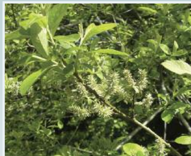
Saileach (willow/sally) Salix

Tá sailligh éagsúla dúchasacha in Éirinn agus is deacair cuid acu a aithint óna chéile. Glacann siad go léir le hithir thais agus bíonn siad le fáil go minic cois aibhneacha agus lochanna. Fásfaidh siad i láithreacha níos tirime freisin áfach. Is í an tsailchearnach, an tsailleach rua nó coitianta agus an crann sníofa na speicis sailí is forleithne. Is féidir formhór na saileach a fhás go héasca as gearrthóga agus fásann siad go mear. Is crainn agus foir tharraingteacha iad agus iad sármhaith don bhfiadhúlra, go háirithe do fheithidí agus d'éin atá ag neadú. Is foinsé thábhachtach neachtair agus pailín do bheacha iad na bláthanna (caitíní) a thagann go luath san Earrach.