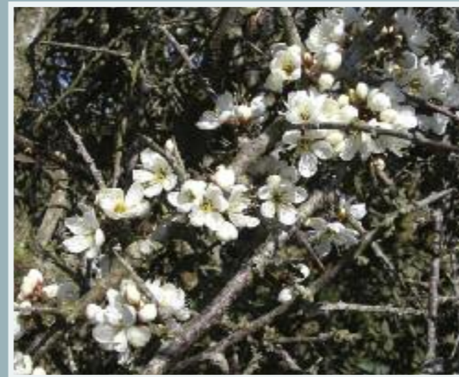
Draighean (Blackthorn/Sloe) Prunus spinosa

Tor le dealga fada géara a bhíonn le fáil go minic i bhfálta sceach. Seasann an draighean amach go luath san earrach le bláthanna gleoite bána a thagann amach roimh na duilleoga (neamhchosúil leis an sceach gheal, a dtagann a chuid bláthanna amach tar éis na duilleoga). Fásann an draighean i réimse leathan ithreacha ach ní fhásann i gcoinníollacha atá an-fhliuch. Tá sé in ann glacadh le láithreacha noхта agus cois cósta. Is tor dlúth é an draighean, a scaipfidh amach mura ndéantar é a bhearradh siar nó a innilt. Tá na caora cosúil le plumaí beaga ach an-searbh. Tugann an tor dealgach clúdach maith neide d'éin agus is foinse luachmhar bia iad na caora d'éin agus do mhamaigh bheaga. Is planda sceiche den scoth é an draighean má tá sceach chosanta in aghaidh stoic ag teastáil.