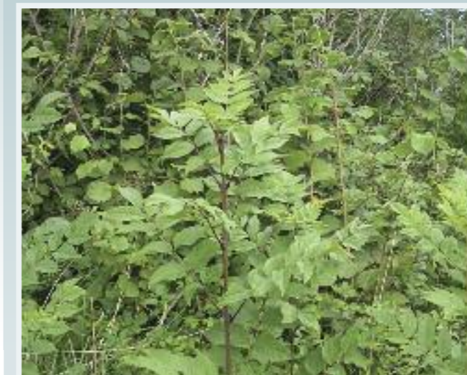
Fuinseog (Ash) Fraxinus excelsior

Tá an fuinseog le fáil go coitianta i gcoillearnaigh agus i bhfálta sceach i nGaillimh. Crann breá mór é, a fhásann i réimse coinníollacha seachas ithreacha aigéadacha nó portaigh. Is féidir leis glacadh le hithreacha taisé troma agus bíonn neart solais uaidh chun fás go maith. Is féidir leis fás i láithreacha nochtá gaothshéide i gceantair chósta. Bíonn an-tóir ag éin, mamaigh bheaga agus ioraí rua ar na síolta.