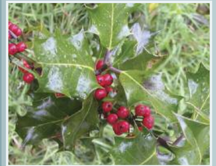
Cuilleann (Holly) Ilex aquifolium

Tá an cuileann ar cheann den bheagán crann leathanduilleacha síorghlasa dúchasacha atá againn. Crann an-tarraingteach is ea é a bhíonn ag fás go minic i bhfálta sceach agus ar réimse leathan ithreacha. Is féidir le cuileann glacadh le láithreacha noхта agus is iontach an scáth ard foscaidh nó sceach é cé go bhfásann sé go mall. Tá na caora beagán nimhneach ach is breá le héin iad, na smólaigh go háirithe. Is maith an láthair fara é an cuileann do na héin sa gheimhreadh. Is é an príomhphlanda bia é don ghormán cuilinn (féileacán).