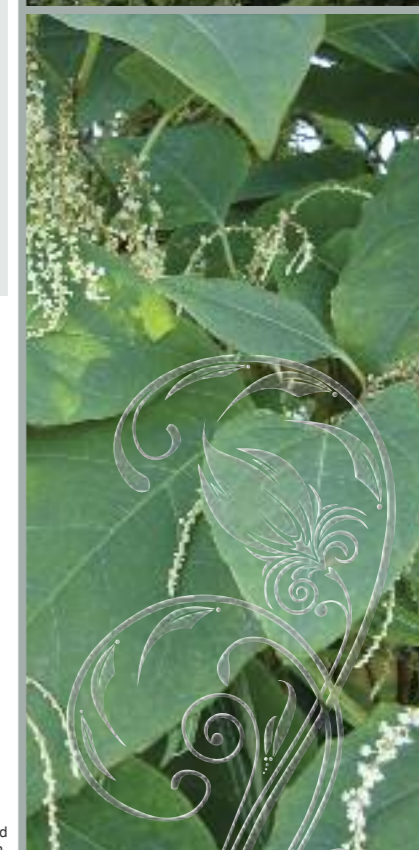
Japanese Knotweed