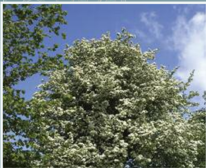
Sceach Gheal (Hawthorn) Crataegus monogyna

Déanann an sceach gheal, an tor is coitianta inár bhfálta sceach, taispeánta iontach de bhláthanna bána san earrach agus de chaora dearga ag deireadh an tsamhraidh agus sa bhfómhar. Tá duilleoga na sceiche gile liopach, rud a dheighleann é ón draighean a bhfuil duilleoga simplí ubhchruthacha aige. Mar gheall ar a ghais dheilgneacha tá an sceach gheal an-úsáideach mar fhál sceach i gcoinne stoic. Fásfaidh an sceach gheal i réimse leathan ithreacha ach is fearr leis ithreacha neodracha nó aolsaibhre le huige mheánach nó throm. Is planda crua é a ghlacann le láithreacha noхта. Tá sé an-luachmhar don bhfiadhúlra mar go dtugann feithidí cuairt ar na bláthanna agus go mbíonn an-tóir ag feithidí agus éin ar na torthaí. Tugann an sceach gheal clúdach maith d'éin atá ag neadú nó ar gor.