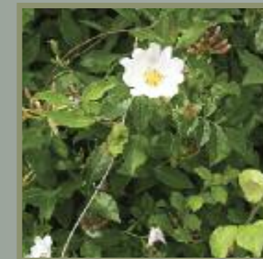
Tábla 1: Cineálacha toir nó crainn atá i sraith tor na bhfálta sceach i nGaillimh

Tá plandaí adhmaid fíthíoch ar fáil go rialta i sceacha na Gaillimhe. Áirítear eidhneán, dris, féithleann agus rós fiáin ina measc. Cuireann na féitheacha seo le hilghnéitheacht bhláthach an fhál sceach. Cuireann eidhneán foinse bia ar fáil d'fheithidí agus d'éin; tá an-tóir ag gach cineál fiadhúlra ar dhris; baineann leamhain neachtar milis as an bhféithleann nuair a mheallann a bhóladh muscáich iad san oíche; agus is foinse thábhachtach bia iad blatmanna agus torthaí an róis fhiáin chomh maith.