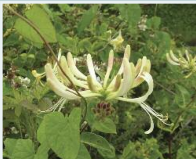
Féithleann (Honeysuckle) Lonicera periclymenum

Is féith adhmadaich é an féithleann atá ar fáil go coitianta i gcoillearnaigh agus i bhfálta sceach dúchasacha. Is fearr leis ithir neodrach nó aigéadach éadrom. Mar fhéith ní mór an féithleann a chur in aice le balla nó sceach chun go bhfásfaidh sé thairis. Cuireann bláthanna móra taibhseacha an fhéithlinn boladh cumhra uaidh san oíche chun leamhain a mhealladh. Is luachmhar an fhoinsé bia d'éin iad na caora geala dearga a thagann ag deireadh an tsamhraidh.