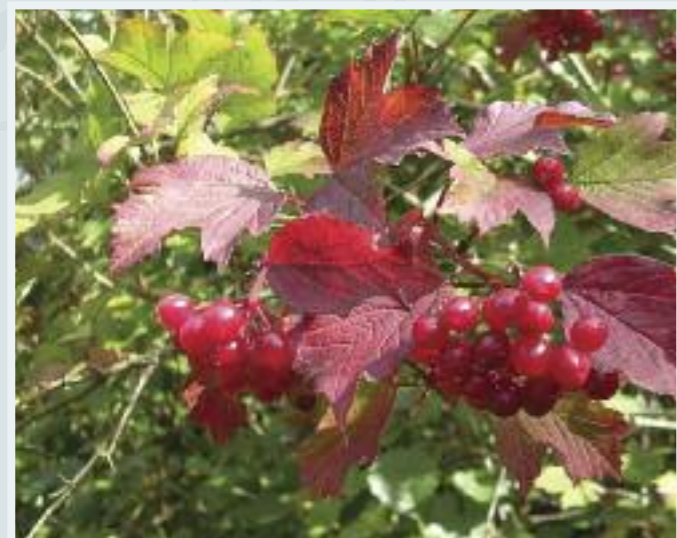
Caorchon (Guelder Rose) Viburnum opulus

Tá an fuinseog le fáil go coitianta i gcoillearnaigh agus i bhfálta sceach i nGaillimh. Crann breá mór é, a fhásann i réimse coinníollacha seachas ithreacha aigéadacha nó portaigh. Is féidir leis glacadh le hithreacha taisé troma agus bíonn neart solais uaidh chun fás go maith. Is féidir leis fás i láithreacha nochtá gaothshéide i gceantair chósta. Bíonn an-tóir ag éin, mamaigh bheaga agus ioraí rua ar na síolta.